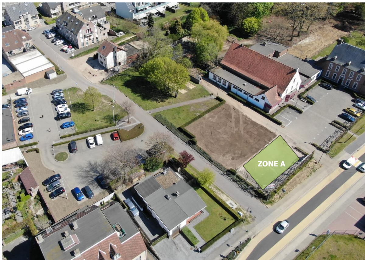
Figuur 1 – van vrijdag 7 juli, 12 uur tot maandag 10 juli 12 uur: parkeerverbod